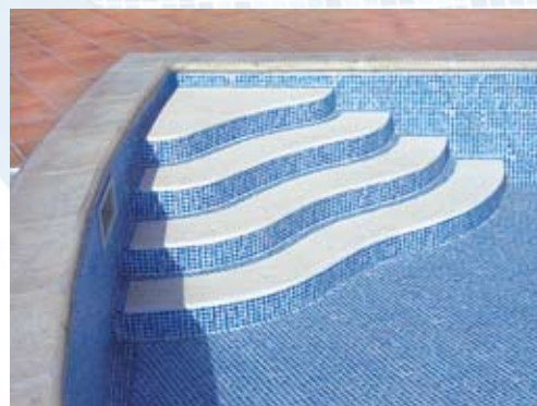
A definição estética