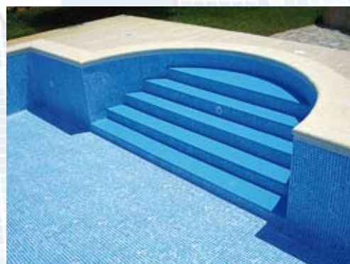
... e o prestígio empresarial